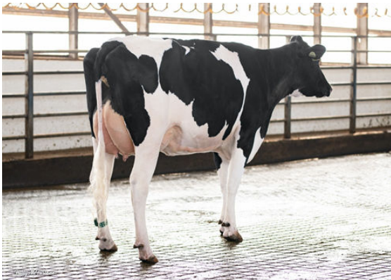
STANTONS FOUNTAIN RESEARCH