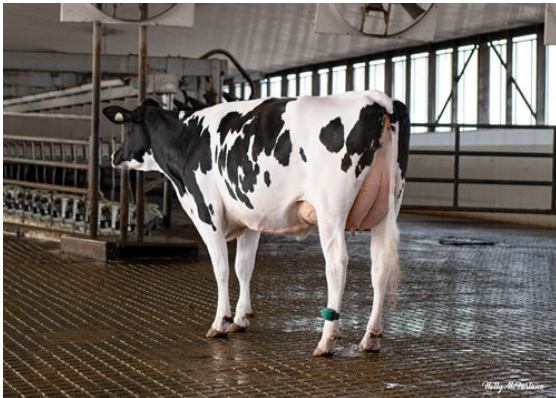
STANTONS FOUNTAIN DRINK